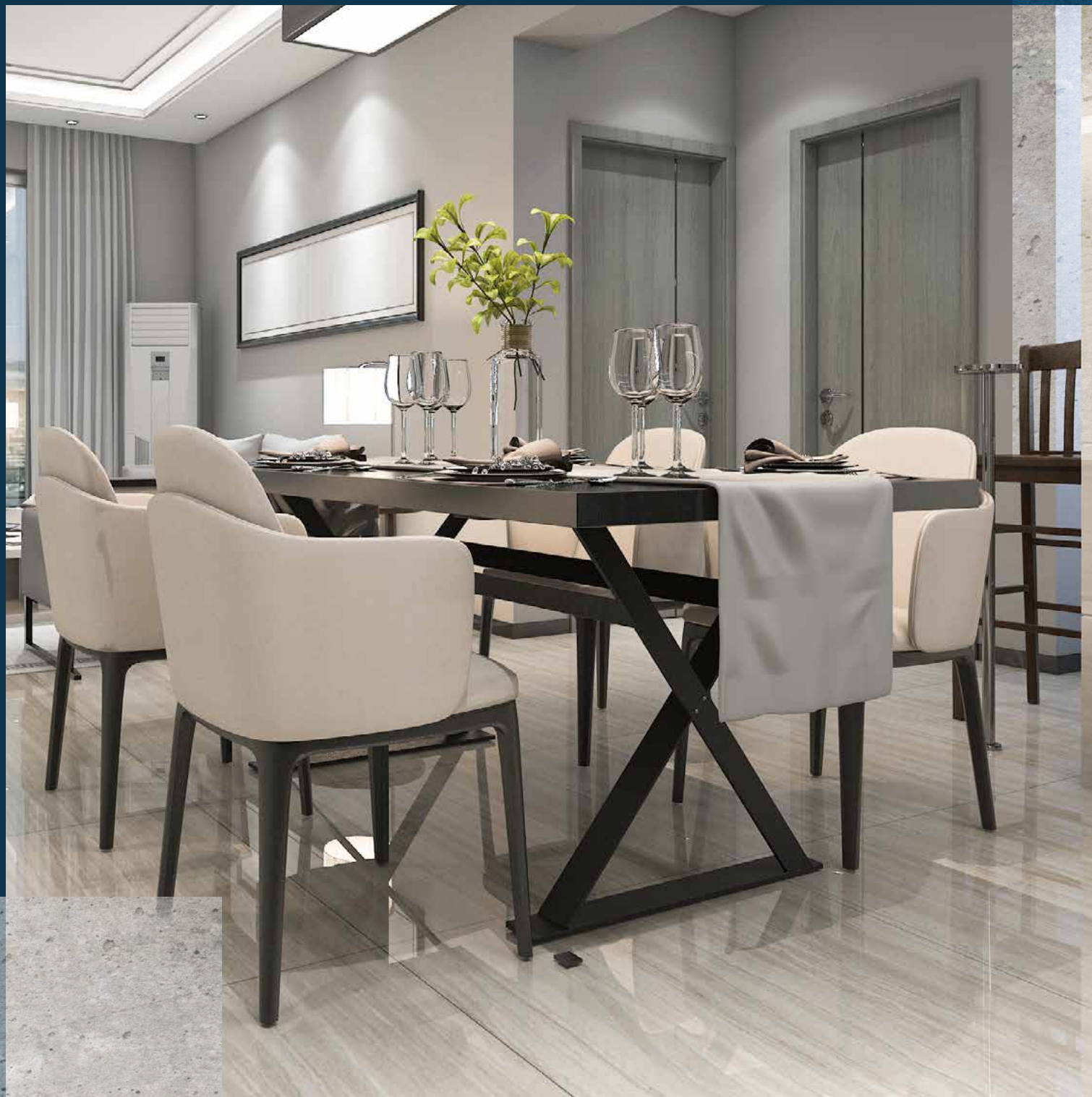
ההדמיות להמחשה בלבד