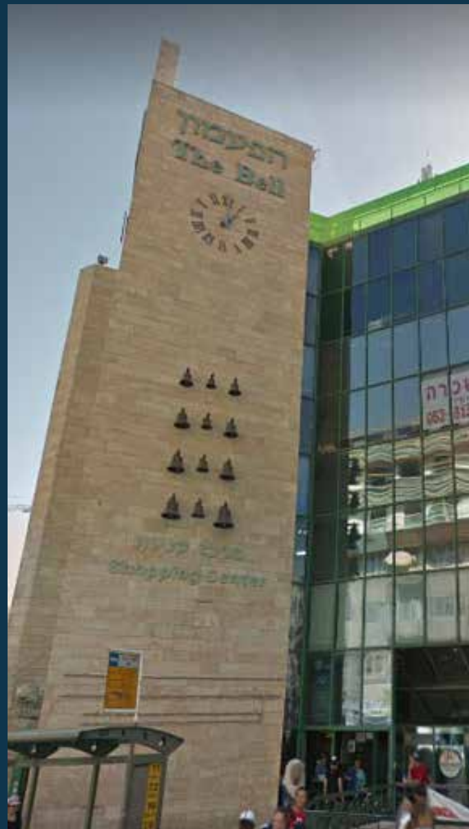
קרתא במרכז הפעמון