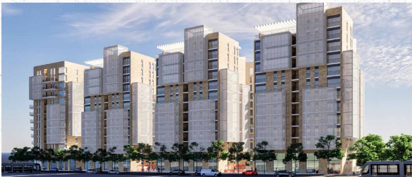
נווה יעקב 18-32