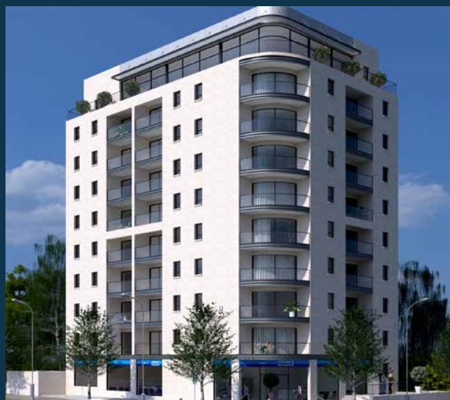
קרתא מול עמק הצבאים