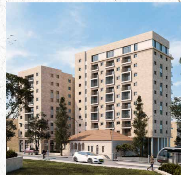
מרים החשמונאית 82