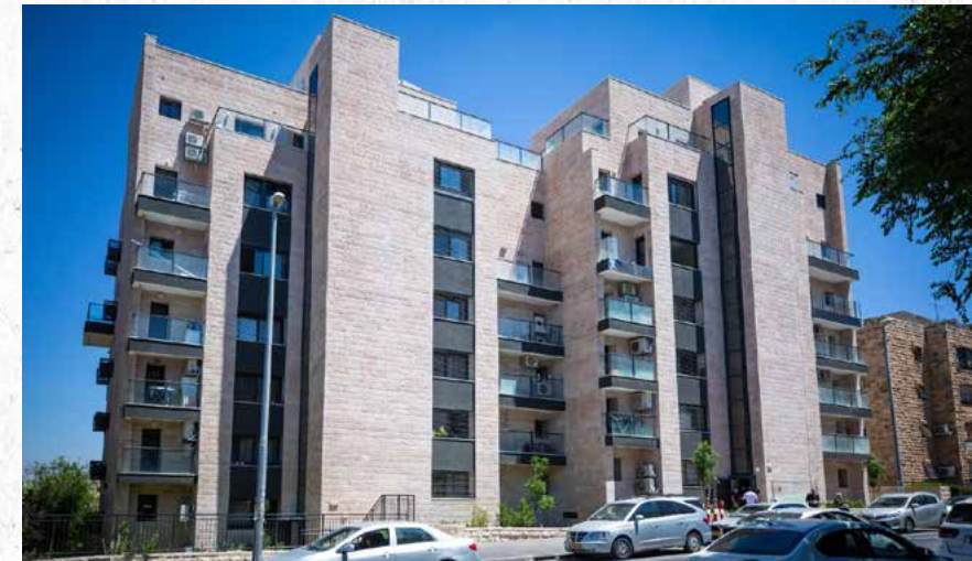
ים סוף 8